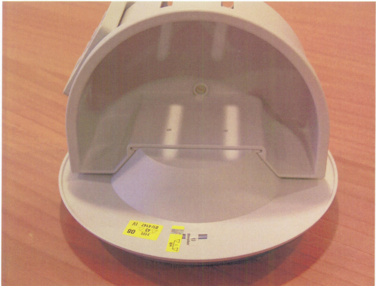
Slika 3: Zaštita od neovlaštena pristupa i smještaj oznake za ovjeravanje mjerila u obliku naljepnice