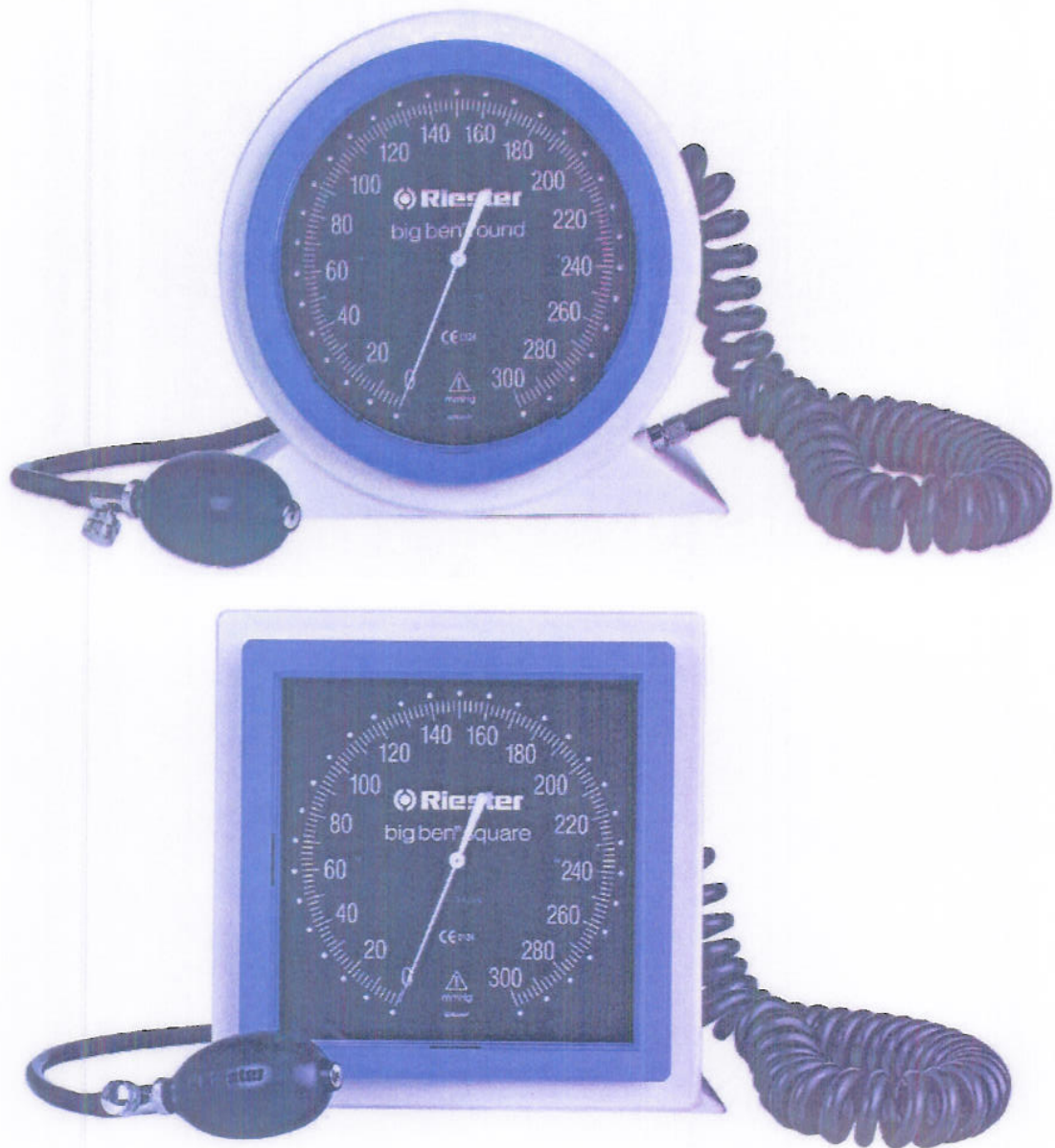
Slika 2: Izgled raznih modela tlakomjera tip big ben

KLASA: UP/I-034-03/10-03/35 URBROJ: 558-02-06-02/1-11-3 PROIZVOĐAČ: Rudolf Riester GmbH (Bruckstrasse 31. D-72417 Jungingen, Njemačka) MJERILO: Uređaj za mjerenje krvnog tlaka TIP MJERILA: big ben Službena oznaka tipa: HR P-3-1049